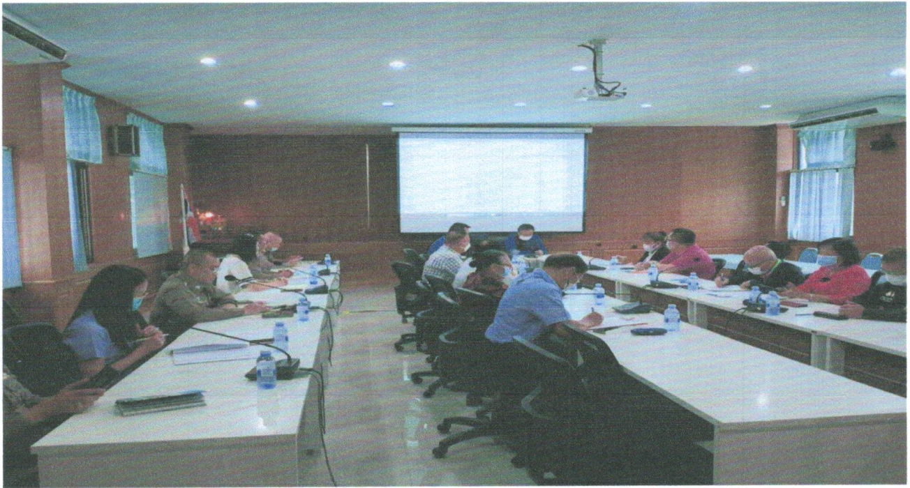
การประชุม คณะกรรมการ คณะทำงาน และผู้เกี่ยวข้อง วันที่ 20 มิถุนายน 2566 เวลา 09.00-16.30 น. ณ ห้องประชุมสำนักงานสาธารณสุขอำเภอเมืองแพร่