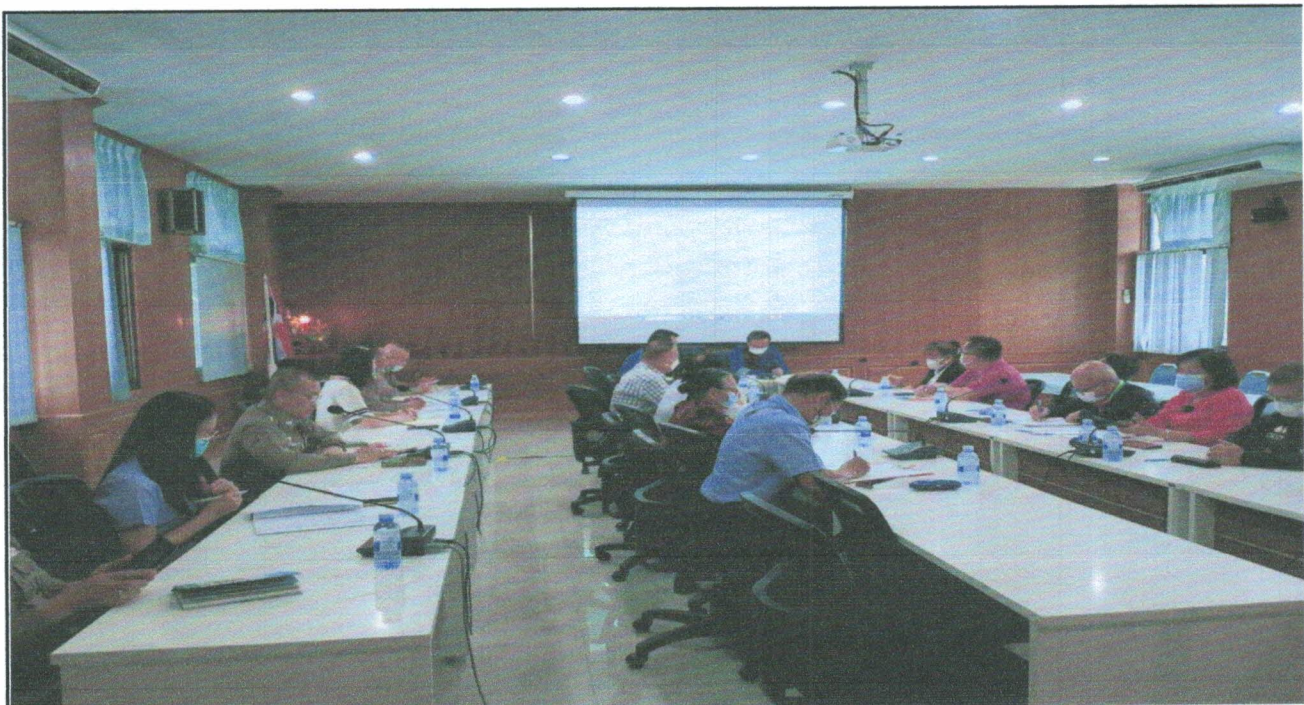
การประชุม คณะกรรมการ คณะทำงาน และผู้เกี่ยวข้อง วันที่ 20 มิถุนายน 2566 เวลา 09.00-16.30 น. ณ ห้องประชุมสำนักงานสาธารณสุขอำเภอเมืองแพร่