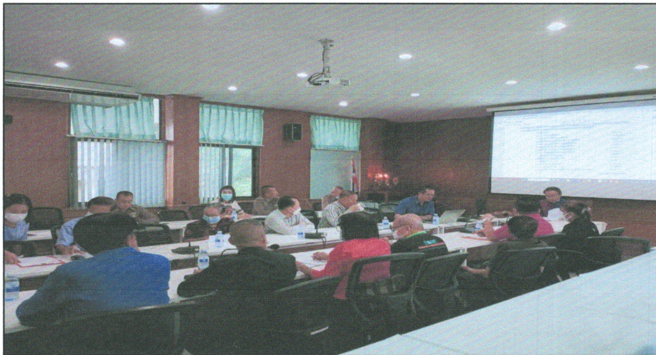
การประชุม คณะกรรมการ คณะทำงาน และผู้เกี่ยวข้อง วันที่ 20 มิถุนายน 2566 เวลา 09.00-16.30 น. ณ ห้องประชุมสำนักงานสาธารณสุขอำเภอเมืองแพร่