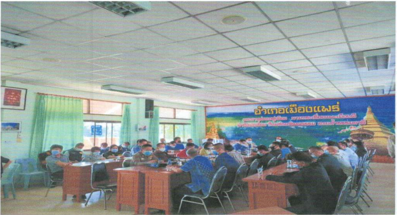
การประชุม คณะกรรมการ คณะอนุกรรมการ คณะทำงาน และผู้เกี่ยวข้อง วันที่ 18 มกราคม 2565 เวลา 08.30-16.30 น. ณ ห้องประชุม ที่ว่าการอำเภอเมืองแพร่