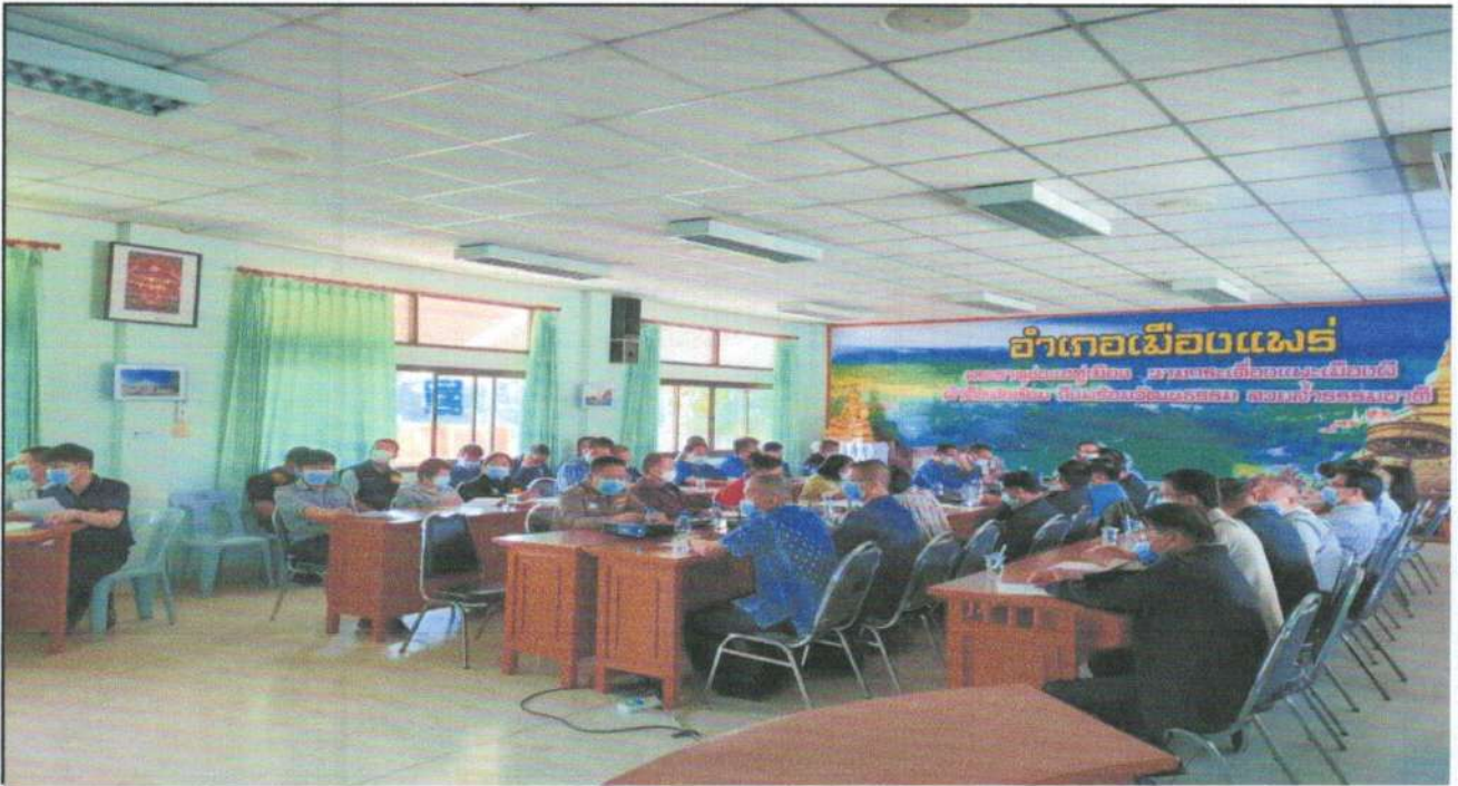
การประชุม คณะกรรมการ คณะอนุกรรมการ คณะทำงาน และผู้เกี่ยวข้อง วันที่ 18 มกราคม 2565 เวลา 08.30-16.30 น. ณ ห้องประชุม ที่ว่าการอำเภอเมืองแพร่